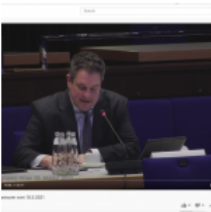
Döring von der FDP

FDP bis 2026 keine Steuern erhöhen möchte.