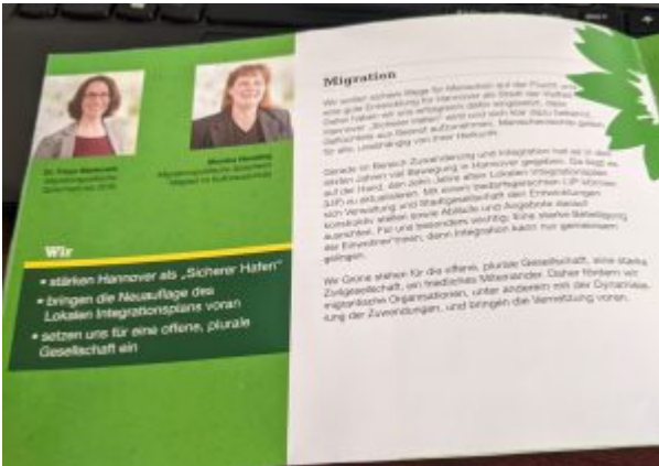
Ein Ausschnitt aus dem Flyer „GRÜNE Halbzeit-Bilanz“. Die Grünen „stärken Hannover als ‚Sicherer Hafen‘“

Wir haben es ja schon mehrfach erklärt: Hannover versteht sich dank der Ampel als „Sicherer Hafen“, erklärt sich also solidarisch, ist aber nicht dem Netzwerk / Bündnis beigetreten. Echte Beitrittsanträge wurden MEHRFACH abgelehnt. Frontex gefällt das ?