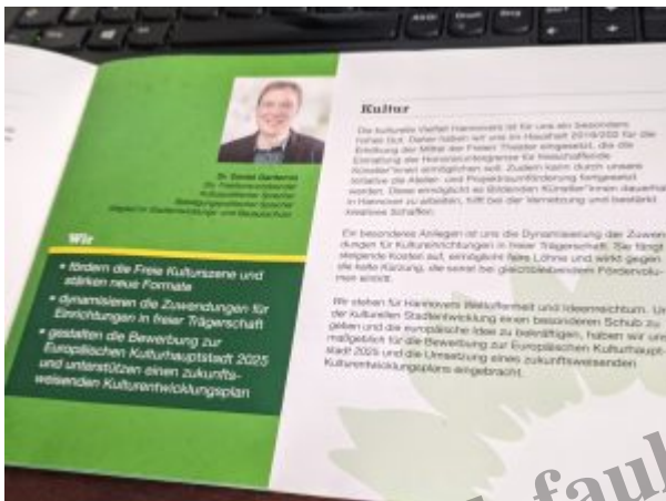
Ein Ausschnitt aus dem Flyer „GRÜNE Halbzeit-Bilanz“. Die Grünen blablabla

geänderter Form so beschlossen wurde, dass er wirklich niemandem weh tut (außer einem waschechten Grünen vielleicht). Mehr zum damaligen Antrag unter Klimaschutz leicht gemacht und wir empfehlen auch Die Ampel in der Klimakrise (beides aus 2019!).