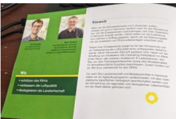
Ein Ausschnitt aus dem Flyer „GRÜNE Halbzeit-Bilanz“. Die Grünen „schützen das Klima“

Wir haben unter dem Titel Die Ampel versteht Hannover als „sicheren Hafen“, will aber weiterhin nicht, dass sie wirklich einer ist schon 2019 alles dazu aufgeschrieben.